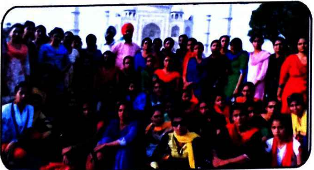
ਸਾਲਾਨਾ ਵਿਦਿਅਕ ਟੂਰ ਦਾ ਦ੍ਰਿਸ਼