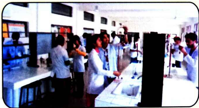
ਕਮਿਸਟਰੀ ਲੈਬ ਦਾ ਇੱਕ ਦ੍ਰਿਸ਼