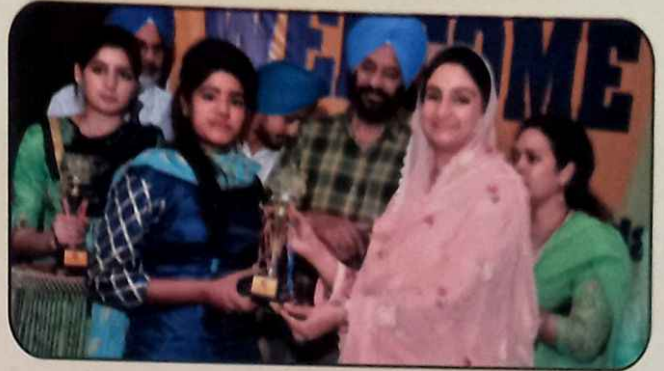
ਬੀਬੀ ਹਰਸਿਮਰਤ ਕੌਰ ਬਾਦਲ ਬੱਚਿਆਂ ਨੂੰ ਸਨਮਾਨਿਤ ਕਰਦੇ ਹੋਏ