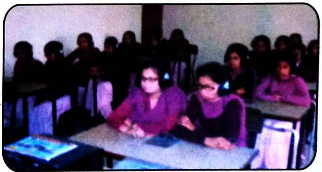
ਕਮਿਊਨੀਕੇਸ਼ਨ ਲੈਬ ਦਾ ਇੱਕ ਦ੍ਰਿਸ਼