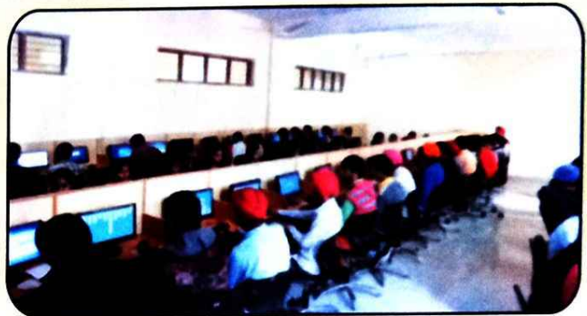
ਕੰਪਿਊਟਰ ਲੈਬ ਦਾ ਇੱਕ ਦ੍ਰਿਸ਼