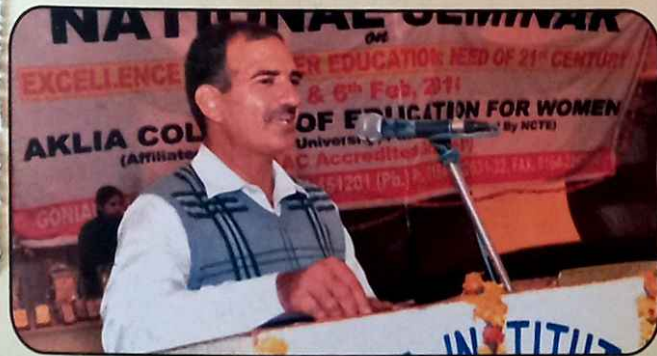
ਪ੍ਰੋ. ਜੇ. ਡੀ. ਨੈਸ਼ਨਲ ਸੈਮੀਨਾਰ ਤੇ ਲੈਕਚਰ ਦਿੰਦੇ ਹੋਏ