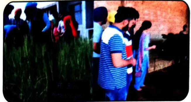
ਐਗਰੀਕਲਚਰ ਦੇ ਵਿਦਿਆਰਥੀ ਫਸਲਾਂ ਸਬੰਧੀ ਜਾਣਕਾਰੀ ਲੈਂਦੇ ਹੋਏ ।