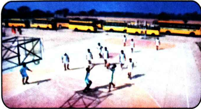
ਖੇਡ ਦੇ ਮੈਦਾਨ ਵਿੱਚ ਬਾਸਕਟ ਬਾਲ ਖੇਡਦੇ ਖਿਡਾਰੀ