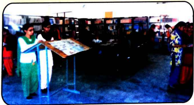
ਲਾਇਬ੍ਰੇਰੀ ਦਾ ਇੱਕ ਦ੍ਰਿਸ਼